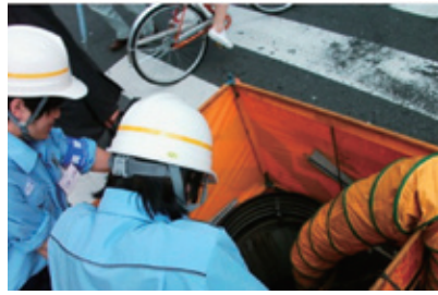
マンホール内工事の見学