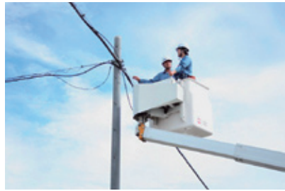
高所作業車での模擬実習