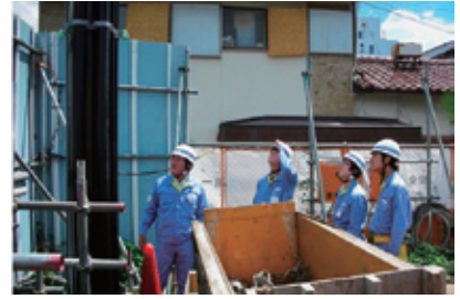
ビル建築現場での調査業務体験