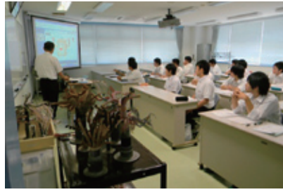
アクセス系設備の講義模様〔西日本研修センター〕