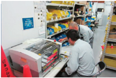
電柱番号札の作成実習