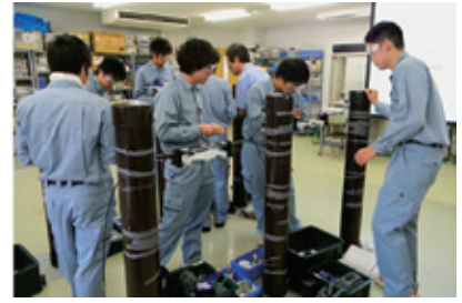
光ケーブル接続の実習模様〔西日本研修センター〕