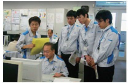
システムによる設計業務体験