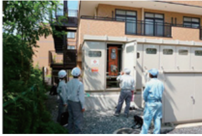
マンションでの開通業務体験