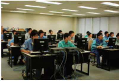
ルータ設定実習〔東日本研修センター〕