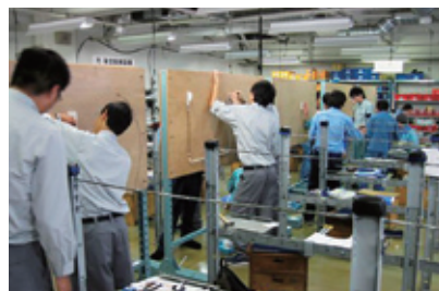
宅内配線実習〔東日本研修センター〕