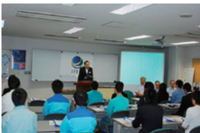
開講式〔東日本研修センター〕