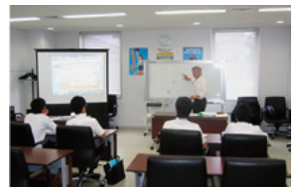
NW系設備の講義模様〔西日本研修センター（九州ロケ）〕