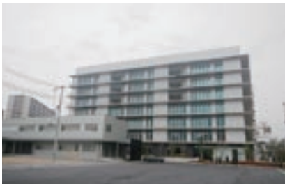
写真1 本館アクセス棟（手前）

西日本研修センターでは、従来よりNTT西日本グループ各社様の研修環境等を活用させていただき各種研修を実施しているところですが、NTT西日本グループ各社様の育成にかかわる人材、各種研修設備が集結する