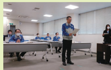
写真5 提案表彰：リモート

しい内容でした。また、現場の声を拾い上げながらさまざまな工夫をされており、今後のSKY活動の刺激