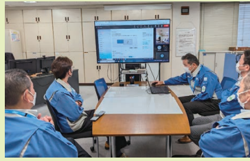
写真7 提案発表：リモート視聴