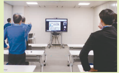
写真8 スローガン唱和