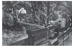
農林水産大臣賞 200年守り抜いた農業用水にスマート技術をオンシザらる未来に継承する 立梅用水土地改良区