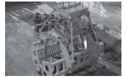
農林水産大臣賞 特殊バケット及びICTを活用した魚礁ブロックの移設方法 株式会社西村組・北海道水産林務部水産局水産振興