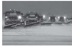
国土交通大臣賞 豪雪空港から発信する空港除雪広報活動 青森県青森空港管理事務所