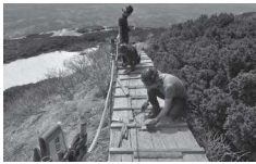
環境大臣賞 大山キャリアダウン・キャリアアップ運動 鳥取県西部総合事務所環境建築局