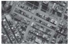
内閣総理大臣賞 レーザー分光式検知器と専用ナビの活用による漏えい検査の効率化 大阪ガスネットワーク株式会社