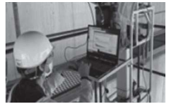
国土交通大臣賞 中性子によるコンクリート塩分濃度非破壊検査の技術開発 理化学研究所