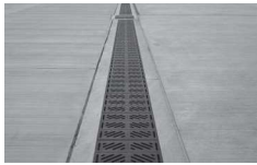
防衛大臣賞 FOD事故を防止するダクタイル鋳鉄製グレーチングGR-U 日之出水道機器株式会社