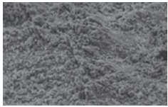
経済産業大臣賞 ポリチューブパウダースケールの分析・除去・抑制技術の確立 四国電力株式会社火力本部火力部