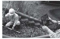
農林水産大臣賞 「やまぐちの農業農村」に関するインフラ総合管理データベースの構築 山口県土地改良事業団体連合会