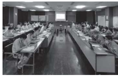
国土交通大臣賞 宮城県上下水一体官民連携運営事業（みやぎ型管理運営方式）の導入 宮城県企業局